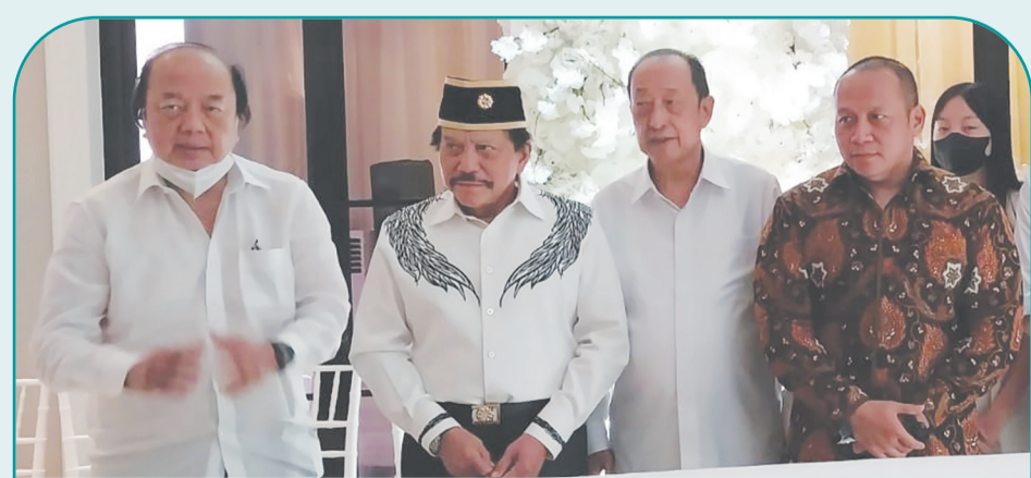
Mantan Kepala BIN AM Hendropriyono (kedua dari kiri), dan Rony AM Hendropriyono (paling kanan), melayat pada Rabu (27/7).